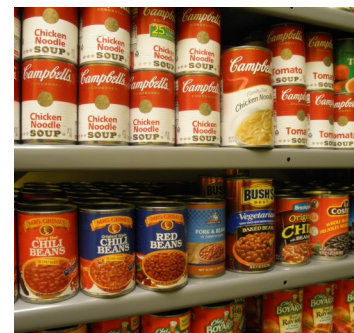
“¡La despensa de comida de Sandburg ya está abierta! Venga a ver lo que tenemos “

Nuestra despensa acepta donaciones de muchos alimentos y elementos esenciales de aseo personal. Artículos de tocador, aceite, productos de limpieza, detergente de ropa y papel higiénico están siempre en demanda. Las donaciones se pueden dejar en la oficina principal.