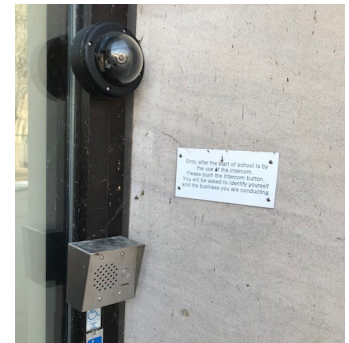
Nuestro timbre se encuentra en la parte inferior derecha, junto al botón grande para discapacitados.

les pedimos a padres y familiares mayores de edad que esperen afuera del edificio para llevarse a sus hijos / hermanos etc. Para así evitar congestionar los pasillos.