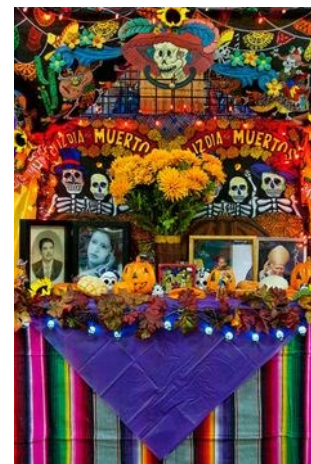
Ejemplo de un altar del día de los muertos.

Además, tenemos una gran necesidad de artículos para nuestro pasillo encantado. Y si tiene disfraces no utilizados (etiquételos con tamaño) o Decoraciones de Halloween por favor envíe sus donaciones con su hijo (a) desde ahora hasta el 9 de octubre.